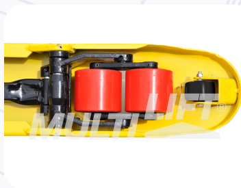
Rodillos de entrada y salida adicionales