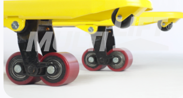
Ruedas de Poliuretano tipo tandem.