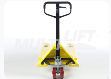
Maneral de operación con manija de 3 posiciones.