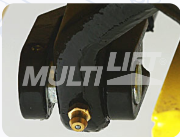
Graseras de lubricación en punto clave.