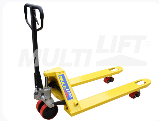
Estructura de Acero con ruedas delanteras y traseras de poliuretano.