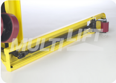
Construcción ultra reforzada.